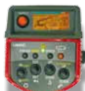
Radiocomando opzionale con visualizzazione digitale