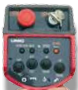
Radiocomando di serie